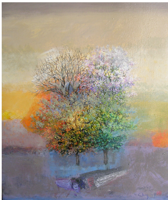
La dégustation Peinture acrylique sur toile