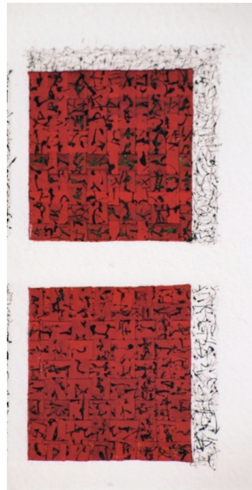
Détail Rituel d'encre

Après avoir exercé le métier de graveur, dont elle garde la discipline, elle se dirige vers l'étude de la calligraphie alliant ainsi forme et fond autour d'une autre de ses passions, l'expression littéraire.