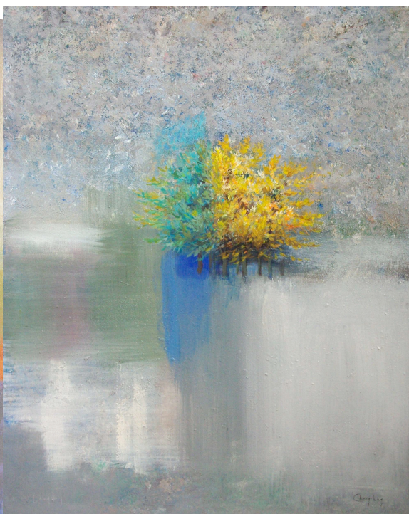
Pétale de jade

Chung-hing écrit et peint. Son parcours artistique l'a conduite de Hong Kong, sa ville natale, à Paris où elle vit depuis un peu plus d'une trentaine d'années.